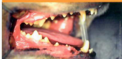
Maladie parodontale précoce