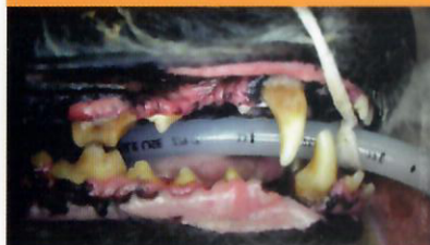
Maladie parodontale modérée