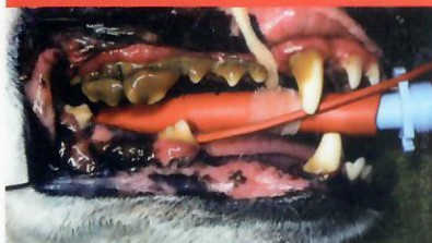
Maladie parodontale avancée